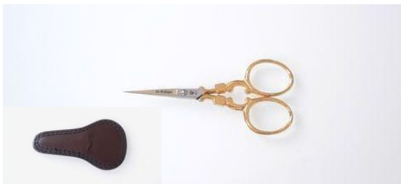
40-35321 カーボン 金足刺繍鋏皮ケース付 終了