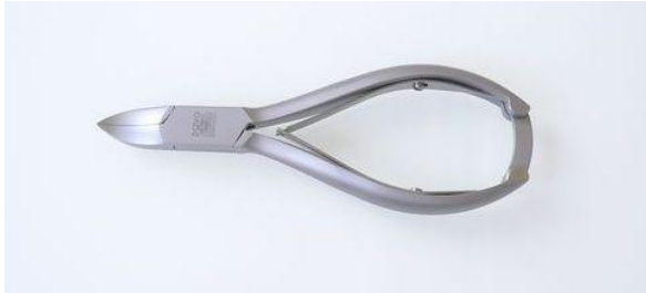
1600-R5.25 ステン/サテン ニッパー爪切 ¥20,000