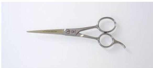
2200-55 ステンカット鋏(磨) 5.5" 終了