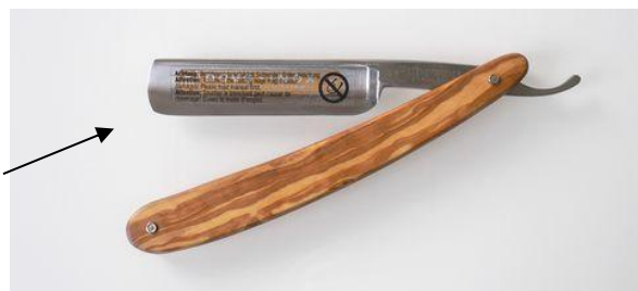
41-5875SS ステンレスレザー オリーブ 終了