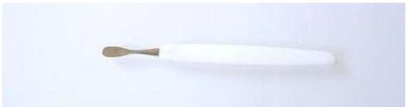
353 P柄 甘皮押え ¥1,650