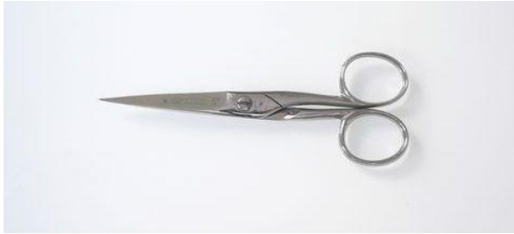
285-507MI ステン 磨尖 洋鋏 5" 終了