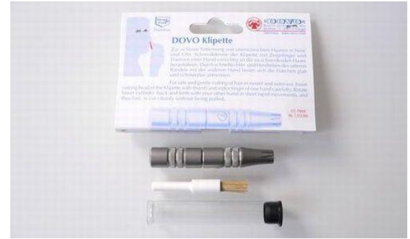
385R ステン 鼻毛バリカン (掃除ブラシ付・台紙付) 終了