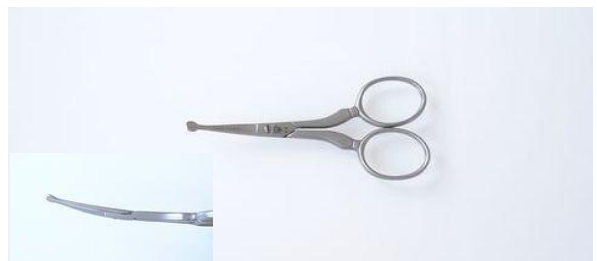
44359 ステン/サテン 鼻毛切鋏(反) 終了