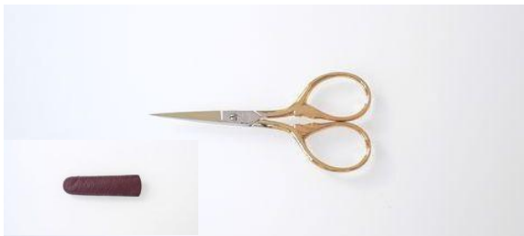
201-353 カーボン 金足刺繍鋏 皮サック付 終了