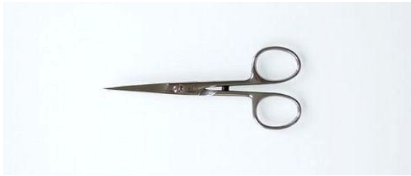
232-447 ステン ミラー 刺繍鋏 4.4" ¥7,500