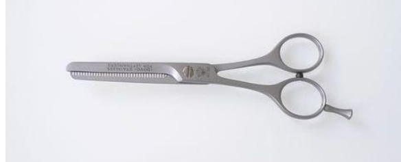
509-40L ステン/サテン スキ鋏(左) 5.5" ¥17,800