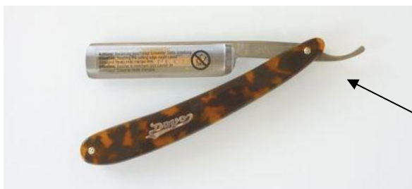
1516-580CO カーボンレザー セルベツ甲 ¥20,000