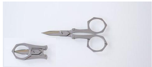
47355 407R ステン 折込鋏 革ケース付 終了