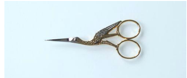
202-453 カーボン ツル 刺繍鋏 4.5" ¥7,400