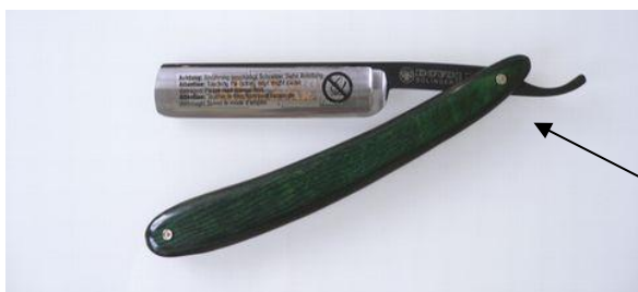
141-584CO カーボン BKレザー GNハツカ-WC ¥22,000