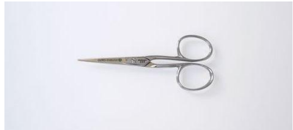
285-4MI ステン 磨細尖 洋鋏 終了