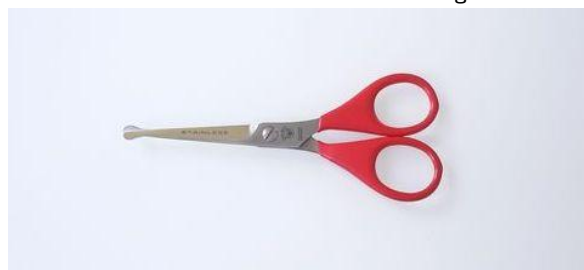
1046-445 ステンヒゲ切鋏(R2・B7) ¥4,800