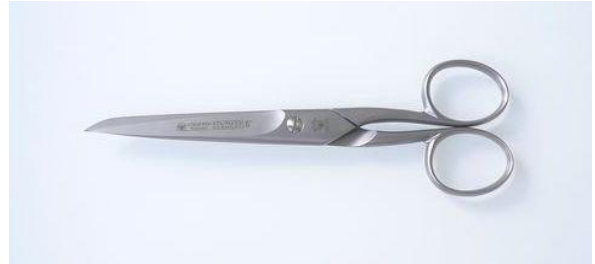
285-606SA ステン/サテン 片丸洋鋏 6" 終了