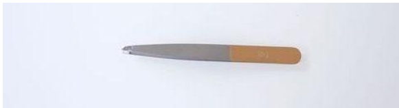
482-4R ステン ツイザー 4" (平) ¥3,000