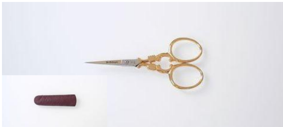
40-353 カーボン 金足刺繍鋏 皮サック付 終了