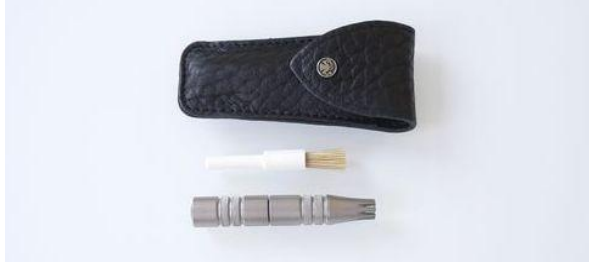
385R ステンロータリー式鼻毛バリカン(革ケース付) 終了