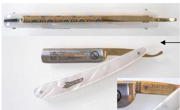
98-5810CO カーボンレザーイミパール(模様入) ¥24,000