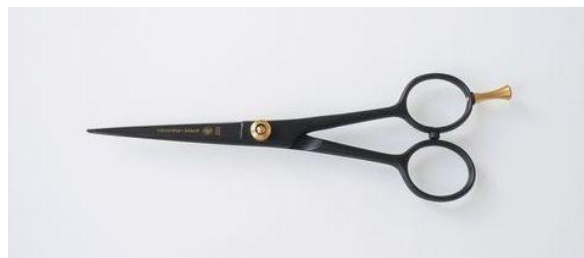
233-5585 BKコバルトカット鋏 5.5"(ネジ付) ¥17,500