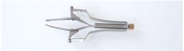
458 オートマチック ツイザー 終了