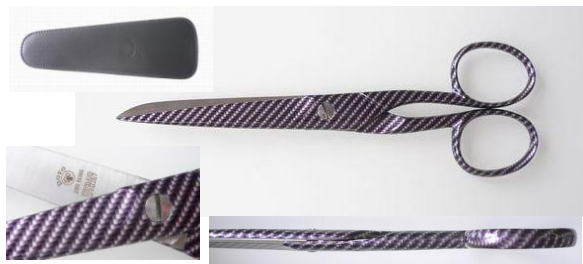
285-6085 ステン 新模様鋏 6"革ケース付 終了