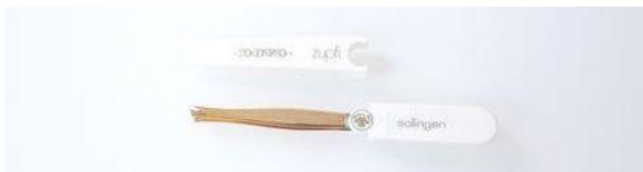
420G キャップ付 ツイザー-GOLD (斜) ¥1,600