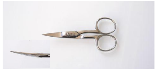
251-405 ステン 磨 爪切鋏 (反) ¥8,800