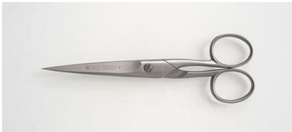
285-608SA ステン/サテン 尖 洋鋏 6" 終了