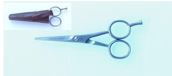
585 056 ステンヒゲ鋏(ケース付) 4.5" ¥10,000