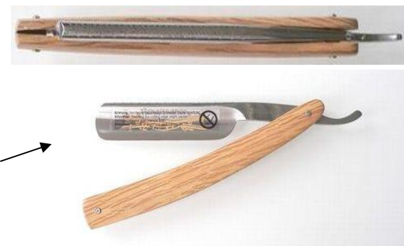
1885-680SS ステンレスレザー スペインオーク ¥30,000