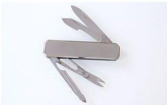
443 ポケットナイフ DOVOマーク (革ケース付) ¥8,000