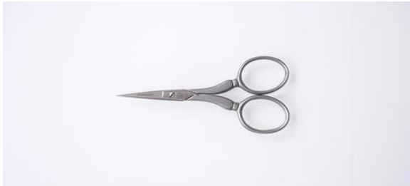
44-350026 ステン サテン 刺繍鋏 ¥7,000