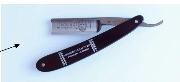
45 581 ステンレス ストレートレザー-R5/8 エボニー ¥23,000