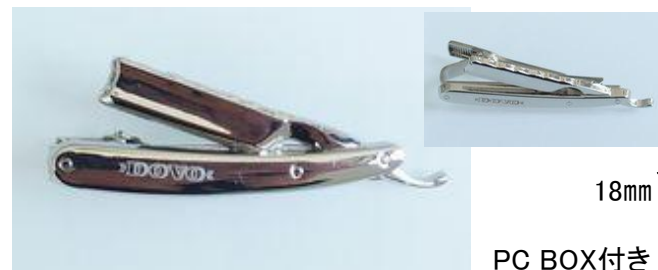
0036 DOVO レザー型タイタック (60mm) ¥6,000. PC BOX付き