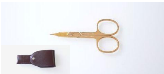
515023G ホケット鋏3.5" (革ケース付) ¥7,000