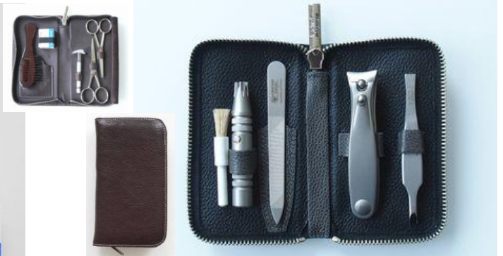
New 4066 116 トラベルセット (5pcs) ¥21,500