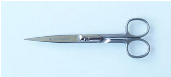
295-607 ステン 先磨尖 洋鋏 6"細身 終了