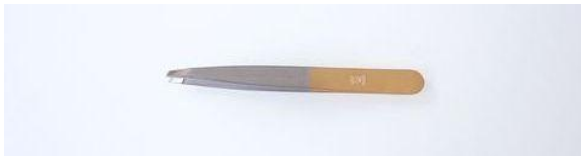
481-4R ステン ツイザー 4" (斜) 終了