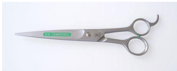
48-846 大型ヘット鋏(巾広) 8.5" ¥14,000