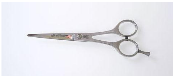
229-555L ステン カット鋏(左) 5.5" ¥27,000