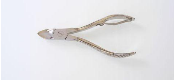
1550-4.5N ニッケル ニッパー型爪切 ¥5,400