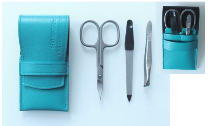
New 1064 156 ステン レディース 3pcs セット ¥9,000