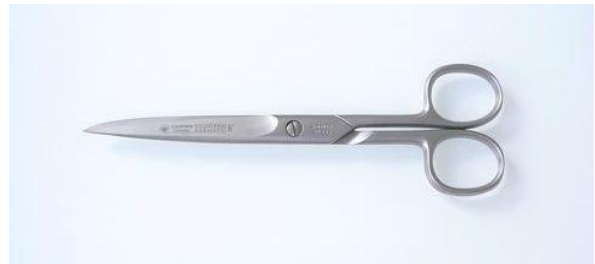
295-606SA ステン/サテン 細 片丸鋏 6" ¥8,600