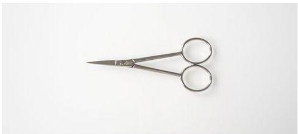
90-400 カーボン シルエット鋏 (直) 4" ¥5,000