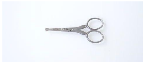
44356 ステン/サテン 鼻毛切鋏(直) 終了