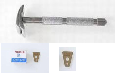
メルクル 907S 口髭用ホルダー 替刃 別売 (10枚入) 終了