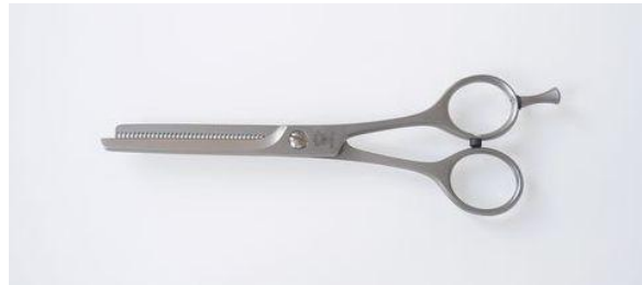
50.40.546 ステン スキ鋏(40目) 5.25" ¥12,500