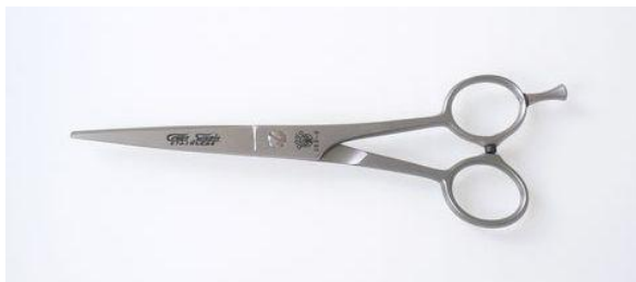
200-606 ステン/サテン 散髪鋏 6" 終了