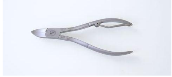
148R5 ステン/サテン ニッパー爪切 5" ¥10,400