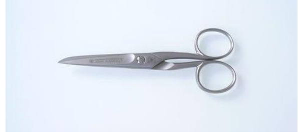
285-506SA ステン/サテン 片丸洋鋏 5" 終了