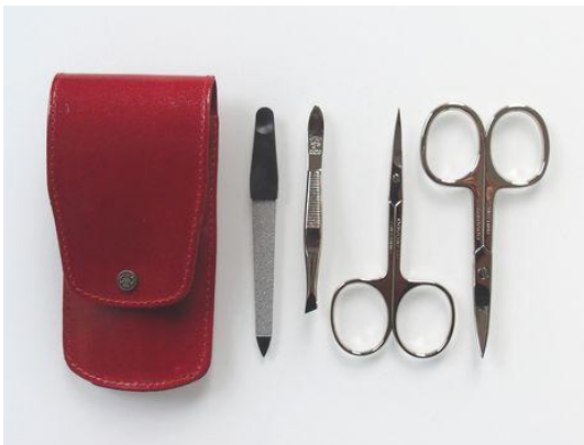
2018-031 レディース 4pcs セット ¥12,600