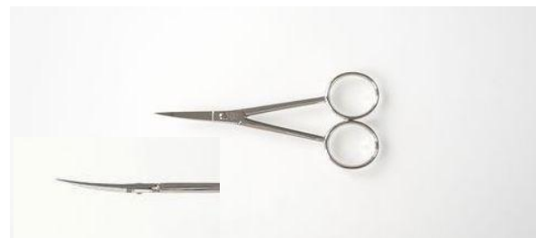
90-409 カーボン シルエット鋏 (反り) 4" 終了