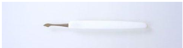
356 P柄 甘皮切 ¥2,000