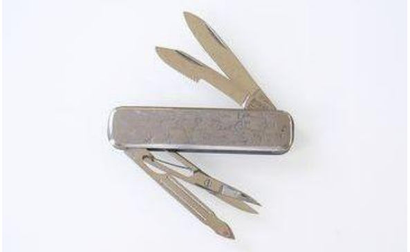
433 ポケットナイフ ハードコフマーク (革ケース付) ¥9,000