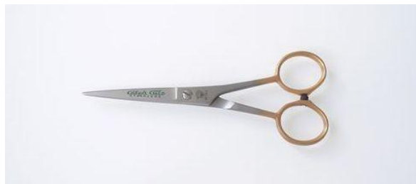
20-506 ステン 金足 カット鋏 5" 終了