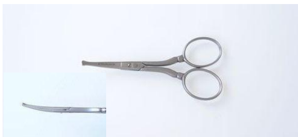
44409 ステン サテン鼻毛兼用ヒゲ鋏(反) 終了