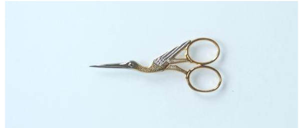
202-353 カーボン ツル 刺繍鋏 3.5" 終了