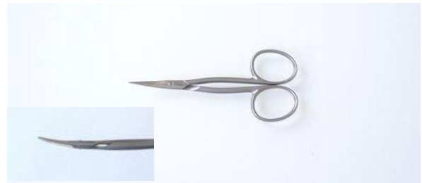
234-356 ステン/サテン 甘皮切鋏 3.5" 終了