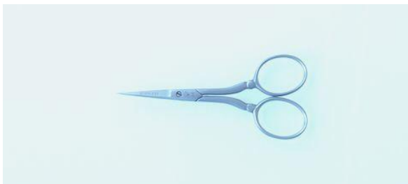
44-400026 ステンサテン シュウ鋏 尖 ¥7,700