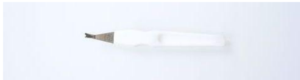
350 P柄 甘皮カッター ¥1,650