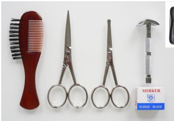
508 051 口髭手入れセット (5pcs) 終了