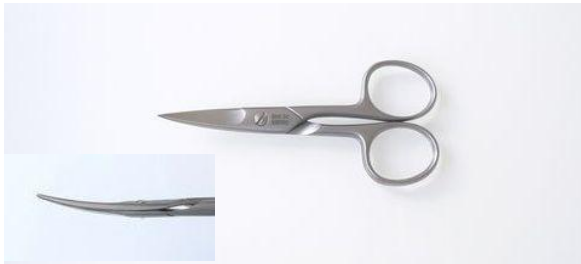
251-406 ステン/サテン 爪切鋏 (反) ¥8,600