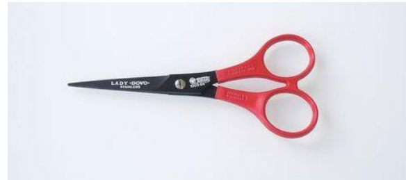
1003-55 テフロン カット鋏 5.5" 終了