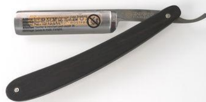
41-5835SS ステンレスレザー エボニー ¥23,000