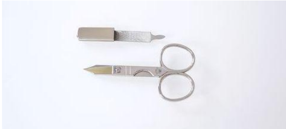
79-350 キャップ付 ホケツ鋏 (爪ヤスリ付) 終了